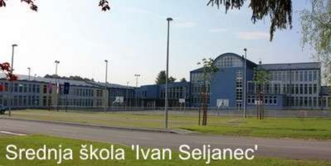
Srednja škola 'Ivan Seljanec'