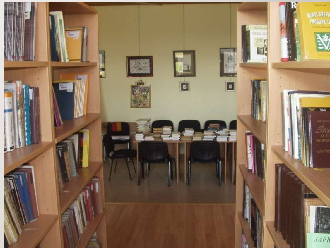
Gimnazija dr. Ivana Kranjčeva Đurđevac