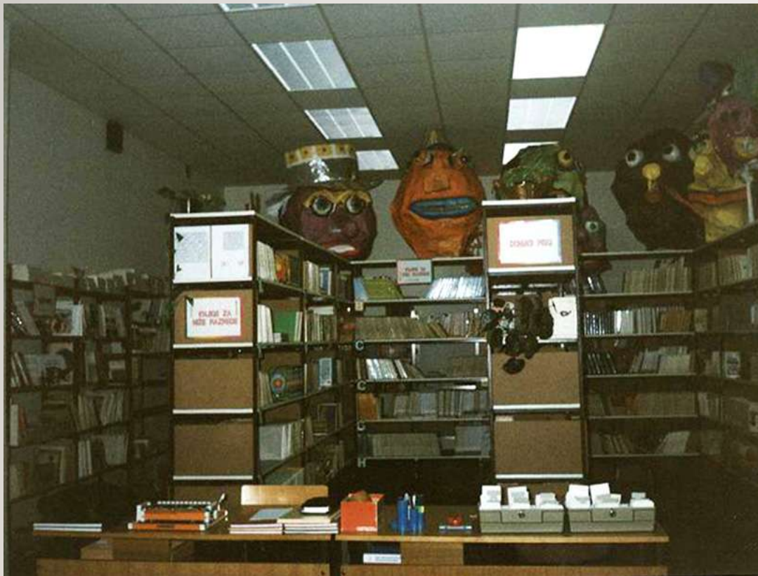
OŠ "Antun Nemčić Gostovinski" Koprivnica