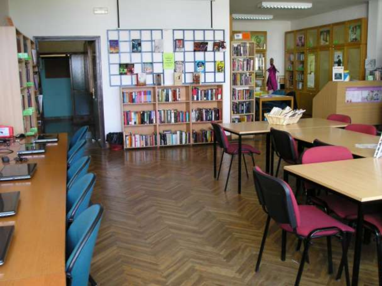
Gimnazija Ivana Zakmardija Dijankovečkoga Križevci