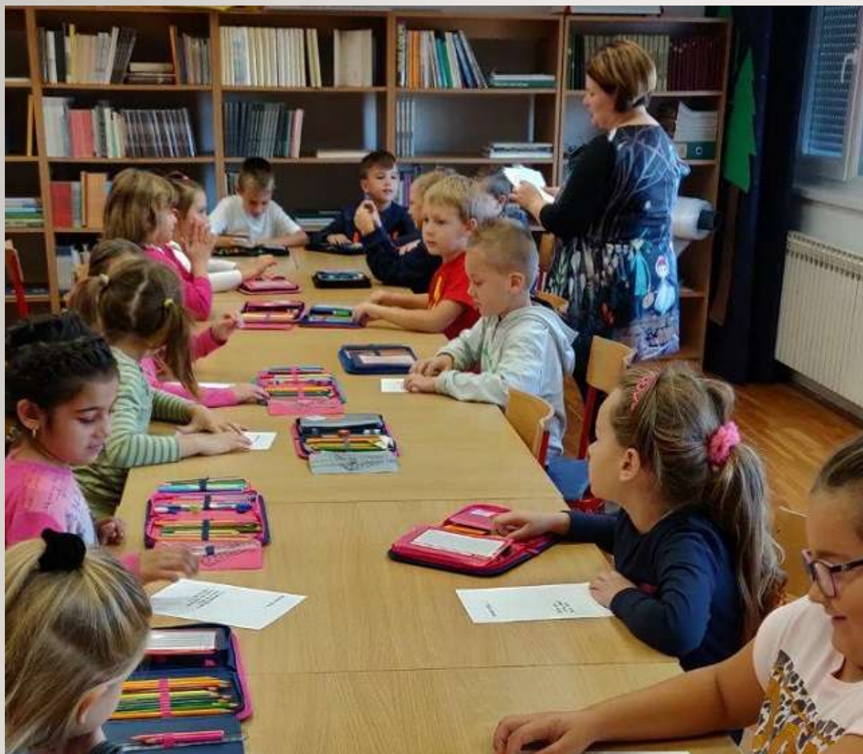
Virje OŠ prof. Franje Viktora Šignjara (1999.)