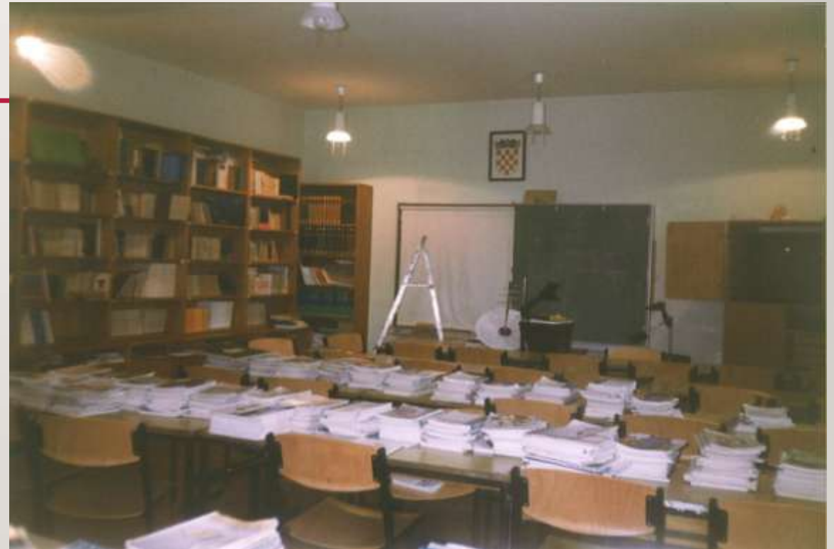
OŠ "Fran Koncelak" Drnje