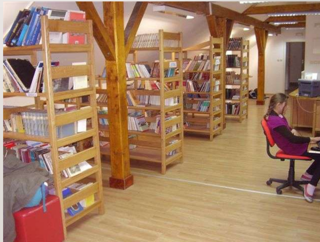
Rasinja OŠ Andrije Palmovića