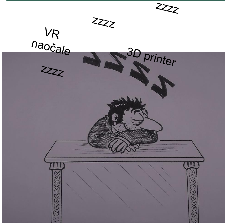
Crtež: Ivan Oslovar

Prijedlog izrade ovakvog Standarda potaknut je željom da Standard bude alat kojim će (ponajprije) školski ravnatelj i školski knjižničar (ali i svi drugi zainteresirani koji imaju interes vezan uz Standard za školske knjižnice) moći brzo, lako, precizno i nedvosmisleno utvrditi/izmjeriti/ocijeniti/evaluirati kako i koliko je neka školska knjižnica usklađena sa Standardom, te precizno utvrditi što sve još treba poduzeti da bi se Standard ostvario u cijelosti . Na temelju takve analize ravnatelj i knjižničar onda mogu napraviti kvalitetan i izvediv plan realizacije svih minimalnih i obvezatnih odredaba standarda. Takvim standardom brzo i precizno bi se također moglo utvrditi kako i koliko je neka knjižnica realizirala odredbe standarda u odnosu na druge knjižnice.