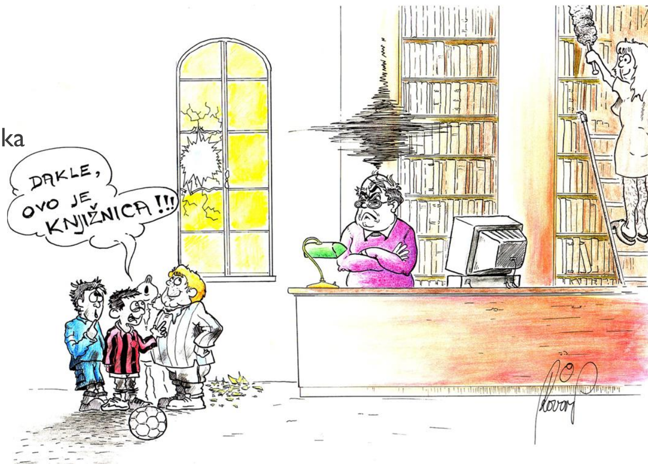
Autor karikature: Ivan Oslovar