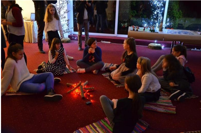
„Večera kod Stribora“