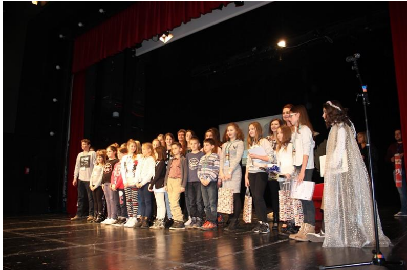
Natjecatelji 4. nacionalnog Natjecanja u čitanju naglas