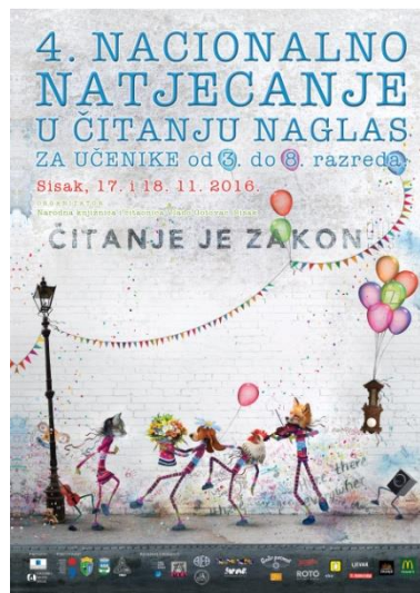
Plakat natjecanja djelo je vizualnog umjetnika Zdenka Bašića

Godine 2017. Sisak će biti domaćin 5. nacionalnog Natjecanja u čitanju naglas za koje se organizator već priprema i nada ugostiti još veći broj sudionika i zainteresirane publike te na taj način doprinjeti poticanju čitanja djece od 3. do 8. razreda osnovnih škola.