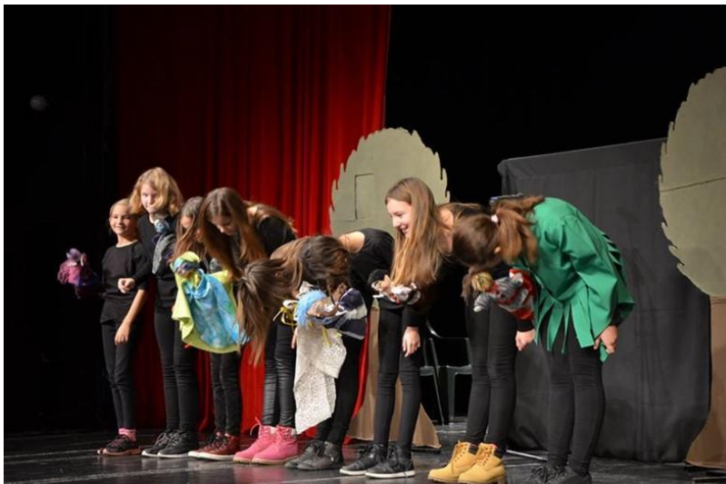
„Kako je Potjeh tražio istinu“