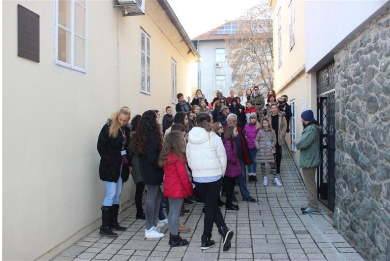
Gradski muzej Sisak

Predstavnici svih županija sa svojim su mentorima prošetali gradom Siskom upoznavajući njegove prirodne i povijesne ljepote i znamenitosti, a Večerom kod Stribora zaokruženo je zajedničko druženje natjecatelja uz sklapanje novih prijateljstava, razmjenu dojmova i iskustava.