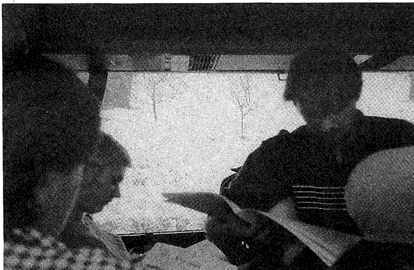
Naši čitatelji na putu za Rovinj, studeni '99

diteljica Mirna Willer). Svih pet radionica podnijelo je završnog dana izvještaj o dvodnevnom radu i donesenim zaključcima. Tako je npr. zaključeno da se elektronička građa treba sustavno obrađivati (za sada to čini jedino NSK), za koju svrhu treba razviti model odabira elektroničke građe na nacionalnom nivou te jasniju legislativu nego što je trenutčno važeća. WEB radionica je istaknula kao prioritetne zadaće osiguranje WEB prostora za AKM ustanove, s odgovornim uredništvom koje bi se trebalo tek ustanoviti, potom u suradnji s CARNet-om izradbu zajedničkog pretraživača za AKM ustanove i rješavanje akutnih problema u vezi skupa znakova hrvatske abecede i usklađivanja meta oznaka. Radionica o digitalizaciji građe uputila je sudionike u tehnološke postupke i primjenu novih tehničkih rješenja digitaliziranja dokumenata i predmeta te razmotrila kriterije za digitaliziranje građe (izuzetno tražena i rijetka građa te ona koju valja zaštititi kao i digitaliziranje u svrhu virtualnih izložbi materijalija koje (više) ne postoje u stvarnosti). O pitanjima stručnog nazivlja istaknuto je da uz zasebnu terminologiju koju treba zadržati svaka struka ponaosob, valja izraditi zajedničko nazivlje koje bi se koristilo u AKM zajednici. U tu se svrhu treba osnovati zasebna radna grupa.