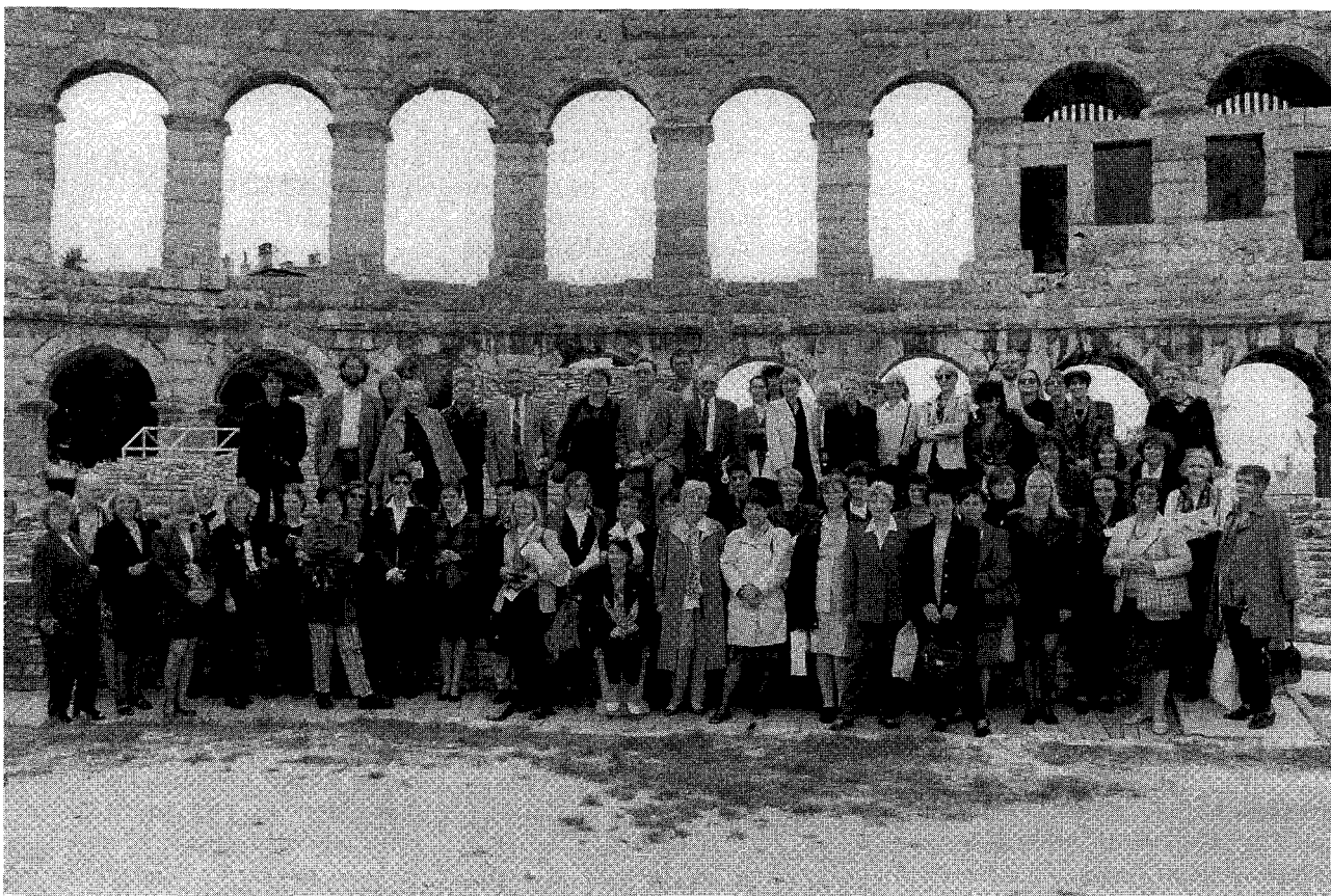
Sudionici svečanog otvaranja Mjeseca hrvatske knjige '99 u pulskoj Areni