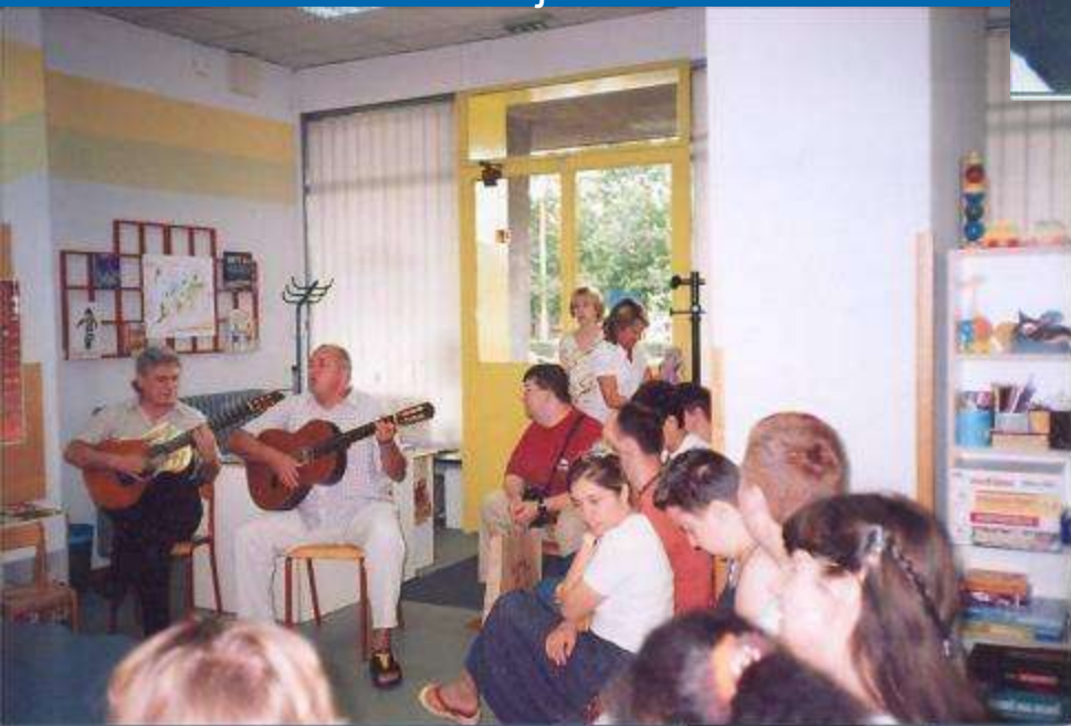
Knjižnica Marina Držića