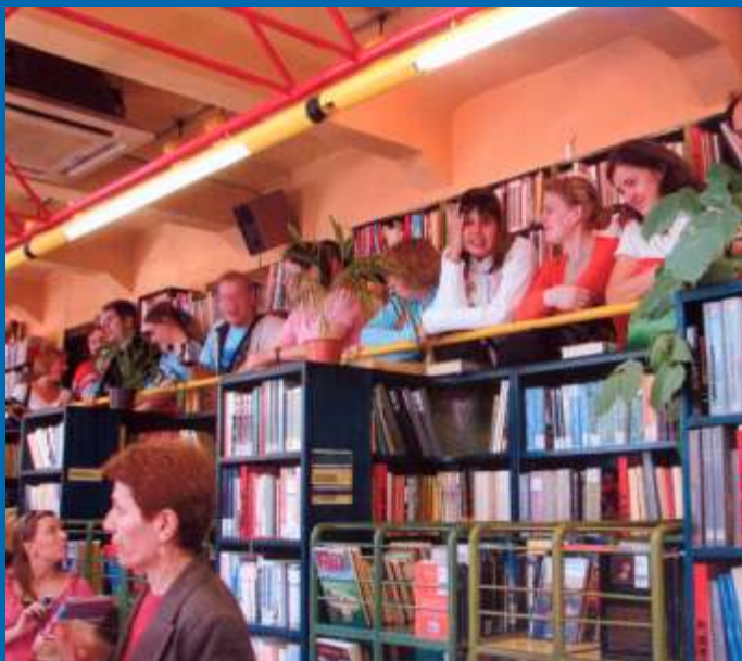
Mladi iz Ozane u Knjižnici Medveščak