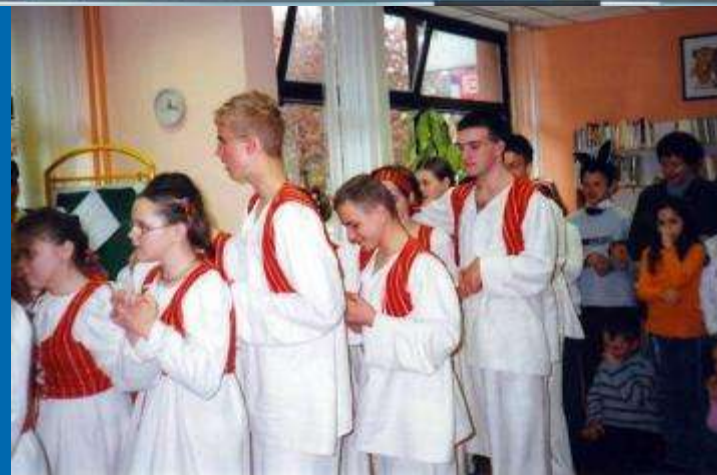
Nastup učenika OŠ Nad lipom u Knjižnici Vladimira Nazora, Gajnice