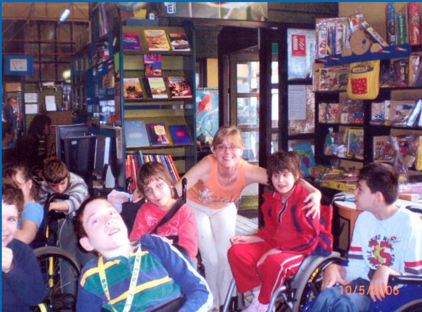
Djeca iz Centra za odgoj i obrazovanje Goljak u Knjižnici Medveščak