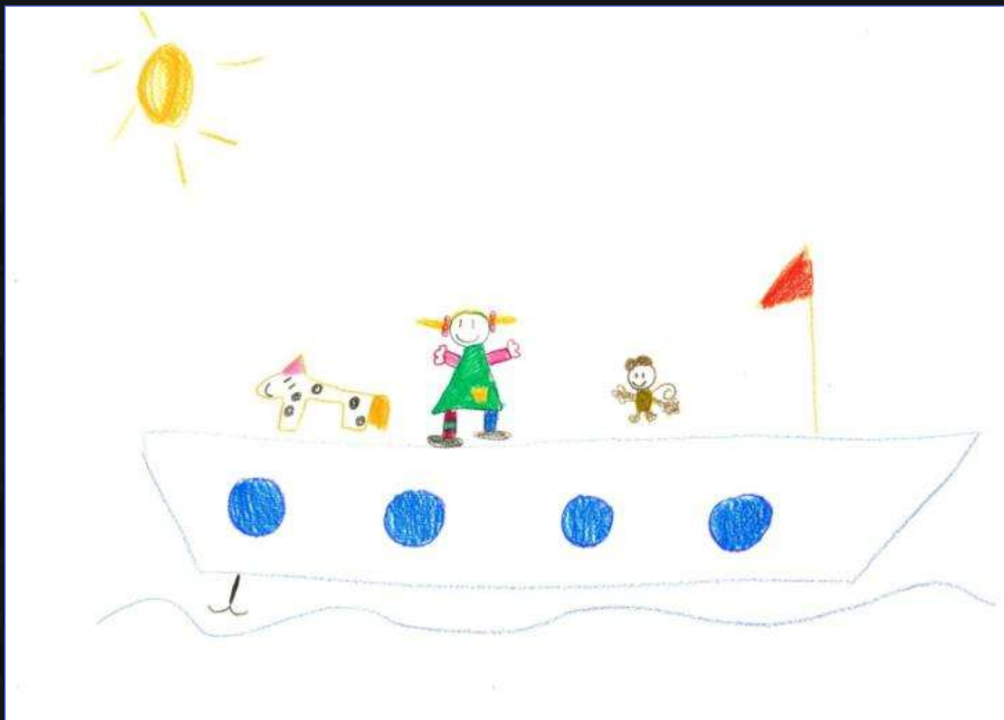
Lana (6,9 god.)