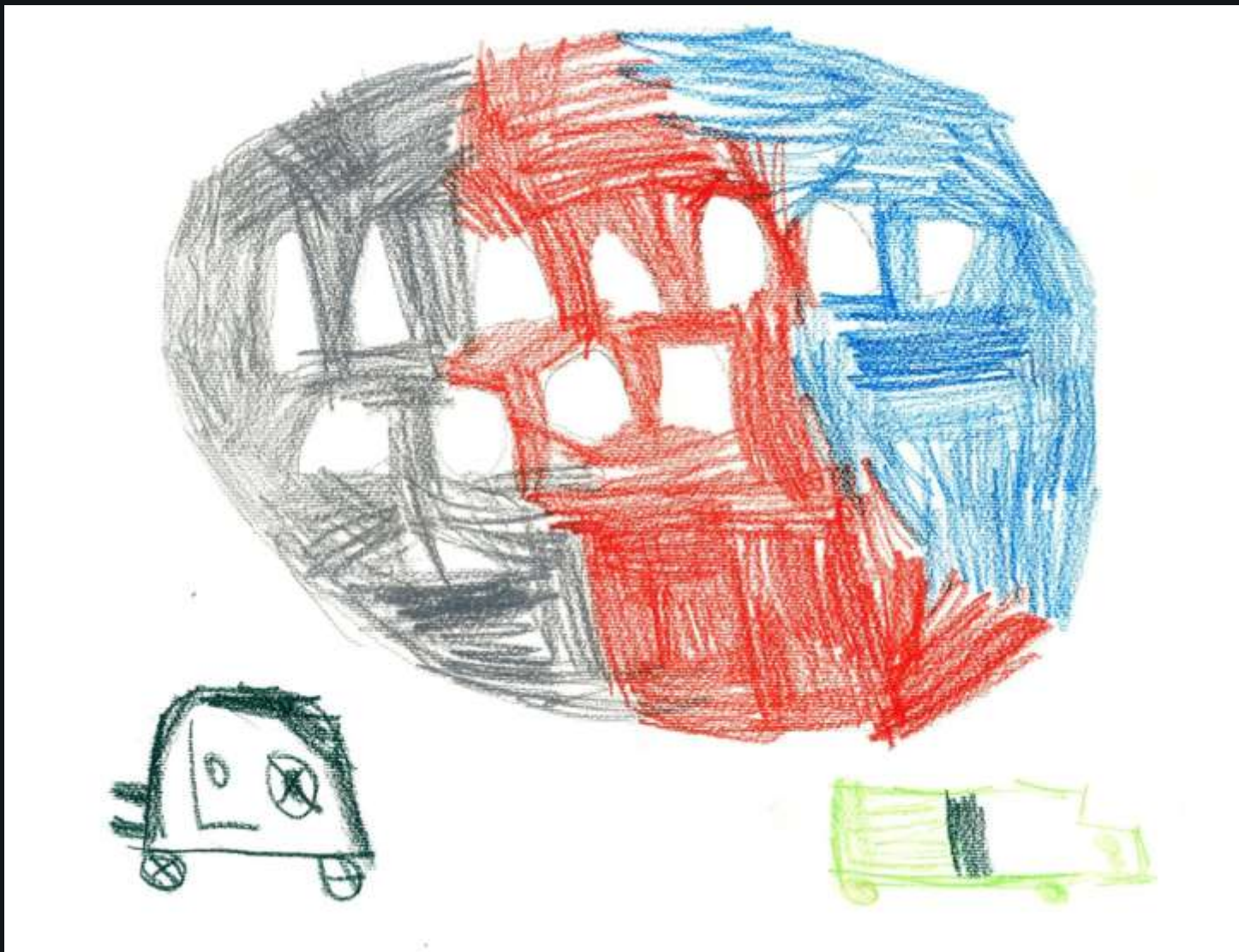
Patrick ( 5,2 god.)