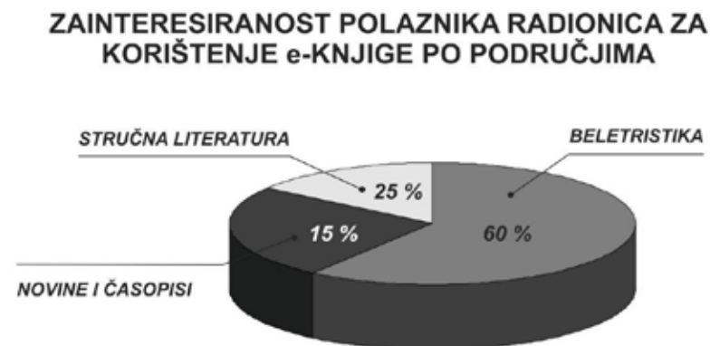
Slika 4. i Slika 5. Interesna struktura polaznika: tiskana – elektronička građa

Iako zbirka na elektroničkom čitaču sadrži elektroničke knjige na engleskom jeziku, postoji zanimanje za elektroničke knjige na hrvatskom i njemačkom jeziku. Nakon predstavljanja, polaznici su također u anketnom upitniku zabilježili svoje dojmove i zapažanja o prednostima i nedostacima čitanja elektroničkih knjiga na elektroničkom čitaču: