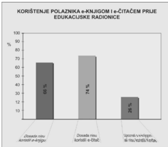
Slika 2. Iskustva polaznika u korištenju elektroničke knjige i elektroničkog čitača

Analizom anketnih upitnika nakon provedene pouke, svi su pohvalili mogućnost korištenja elektroničkog čitača u knjižnici i smatraju da su radionice korisne, a većina (93 posto) je zainteresirana za mogućnost posuđivanja elektroničkih knjiga. Ipak, 25 posto polaznika smatra da ne bi posudili elektronički čitač umjesto papirnate knjige.