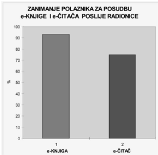
Slika 3. Zanimanje polaznika za posudbu elektroničke knjige i elektroničkog čitača

Analizom anketnih upitnika nakon provedene pouke, svi su pohvalili mogućnost korištenja elektroničkog čitača u knjižnici i smatraju da su radionice korisne, a većina (93 posto) je zainteresirana za mogućnost posuđivanja elektroničkih knjiga. Ipak, 25 posto polaznika smatra da ne bi posudili elektronički čitač umjesto papirnate knjige.